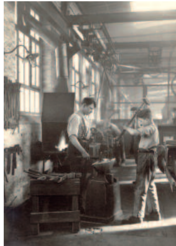
Die Sicherung einer qualitativ hochwertigen Ausbildung des Nachwuchses wird bei Schenck von jeher groß geschrieben. Hier ein Bild der Lehrlingswerkstatt aus den 1920er Jahren.

Seit dem Jahr 2000 ist die Carl Schenck AG eine Tochtergesellschaft des global agierenden Dürr-Konzerns. Die Kernkompetenz der zur AG gehörenden „Schenck RoTec GmbH“ umfasst alle Aktivitäten auf dem Gebiet des Auswuchtens und der Diagnose-technik. Im Jahr 2004 wird der „Schenck Technologie- und Industriepark“ eröffnet. Er stellt heute mit über 70.000 m 2 Büro- und Hallenfläche wertvolle räumliche Kapazitäten bereit, die mit zahlreichen Serviceleistungen verbunden sind.