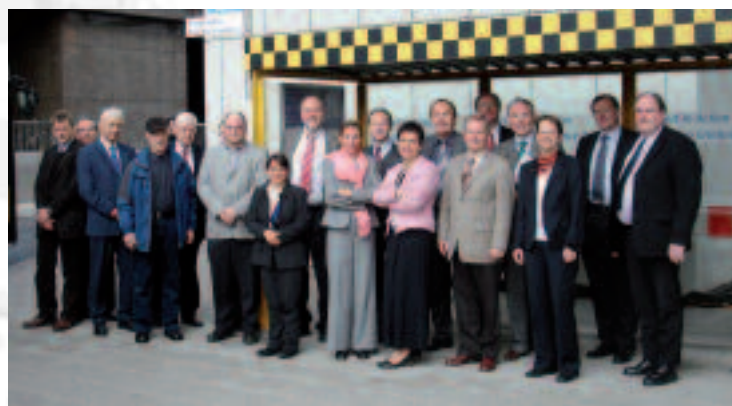
Teilnehmer der Flughafenbesichtigung nach der Rundfahrt.

von rund 80 Prozent bis zum Jahr 2015 erwartet. Um diesen Prognosen Rechnung zu tragen, plant die Fraport AG, die Kapazitäten am Standort Frankfurt deutlich zu erhöhen. Die wichtigsten Maßnahmen hierzu sind neben dem Bau der neuen Landebahn Nord-West, die – unter Berücksichtigung eines Nachtflugverbots – eine Steigerung der stündlichen Flugbewegungen von zurzeit 83 auf schrittweise ca. 120 mit sich bringen wird, der Bau des Terminals 3 und der Werft für den neuen