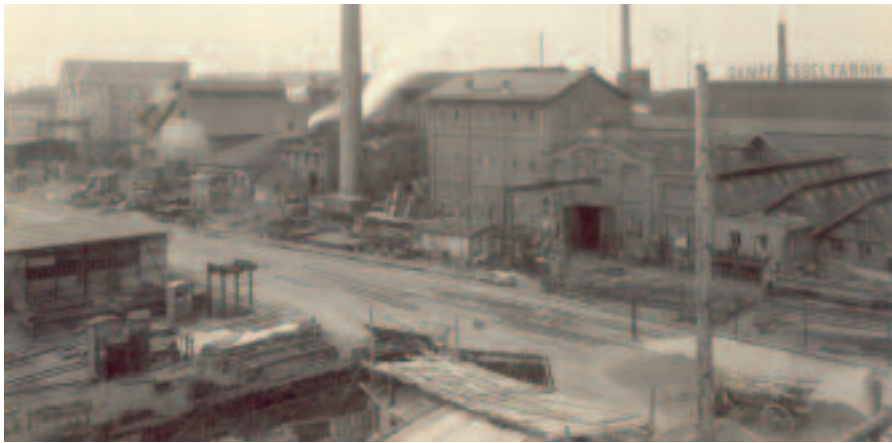
Blick auf die Fabrikstraße, um 1915.